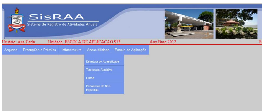
Figura 5.1: Menu do sistema